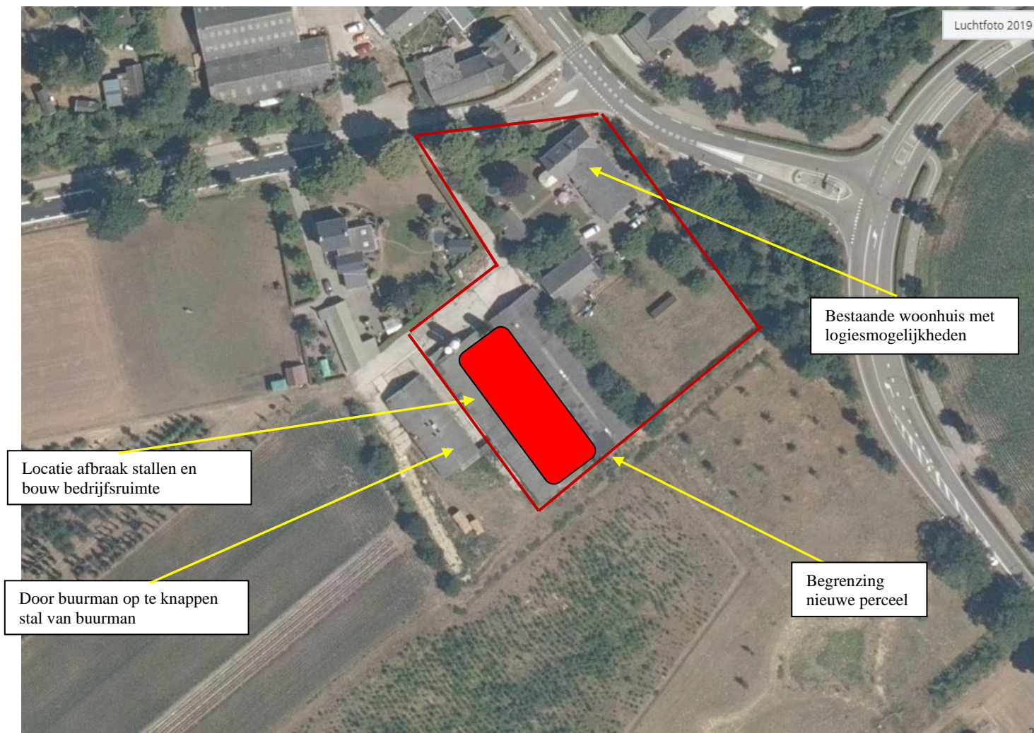
Figuur 1: De locatie met de nieuwe bedrijfsruimte weergegeven

Duidelijk is dat op de plek van de bestaande bebouwing ook de nieuwe bebouwing komt te staan met een oppervlakte van ca 1250 m 2 . Met een juiste kwaliteitsimpuls groene in de nieuwe situatie is dit gebouw passend bij de overige bebouwing/clustering.