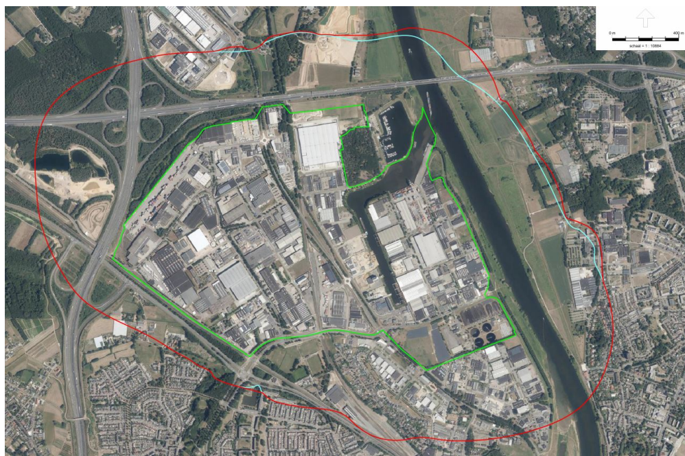
Figuur 4.1: visualisatie oude geluidszone (lichtblauw) en nieuwe geluidszone (rood)

Bij een aanpassing van de zone dienen de akoestische gevolgen voor de geluidsgevoelige objecten in kaart te worden gebracht (artikel 42 Wgh). Daarnaast dient voor eventuele nieuwe geluidgevoelige objecten die zijn gelegen binnen de nieuw vast te stellen zone een hogere waarde te worden vastgesteld. Eventueel dient voor objecten binnen de bestaande zone een verhoging van de bestaande hogere waarde te worden vastgesteld. In artikel 55 Wgh wordt voor bestaande geluidzones geregeld dat de hogere waarden voor woningen binnen de (nieuwe) zone kunnen worden verhoogd. Als voorwaarden gelden dan: