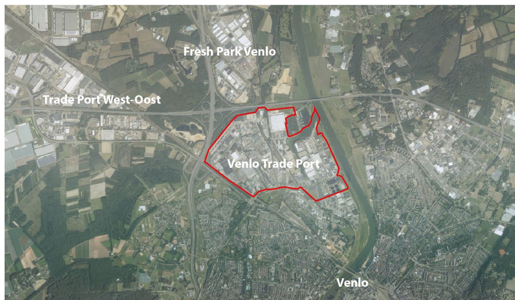
Figuur 1.1: Ligging plangebied (Globespotter)