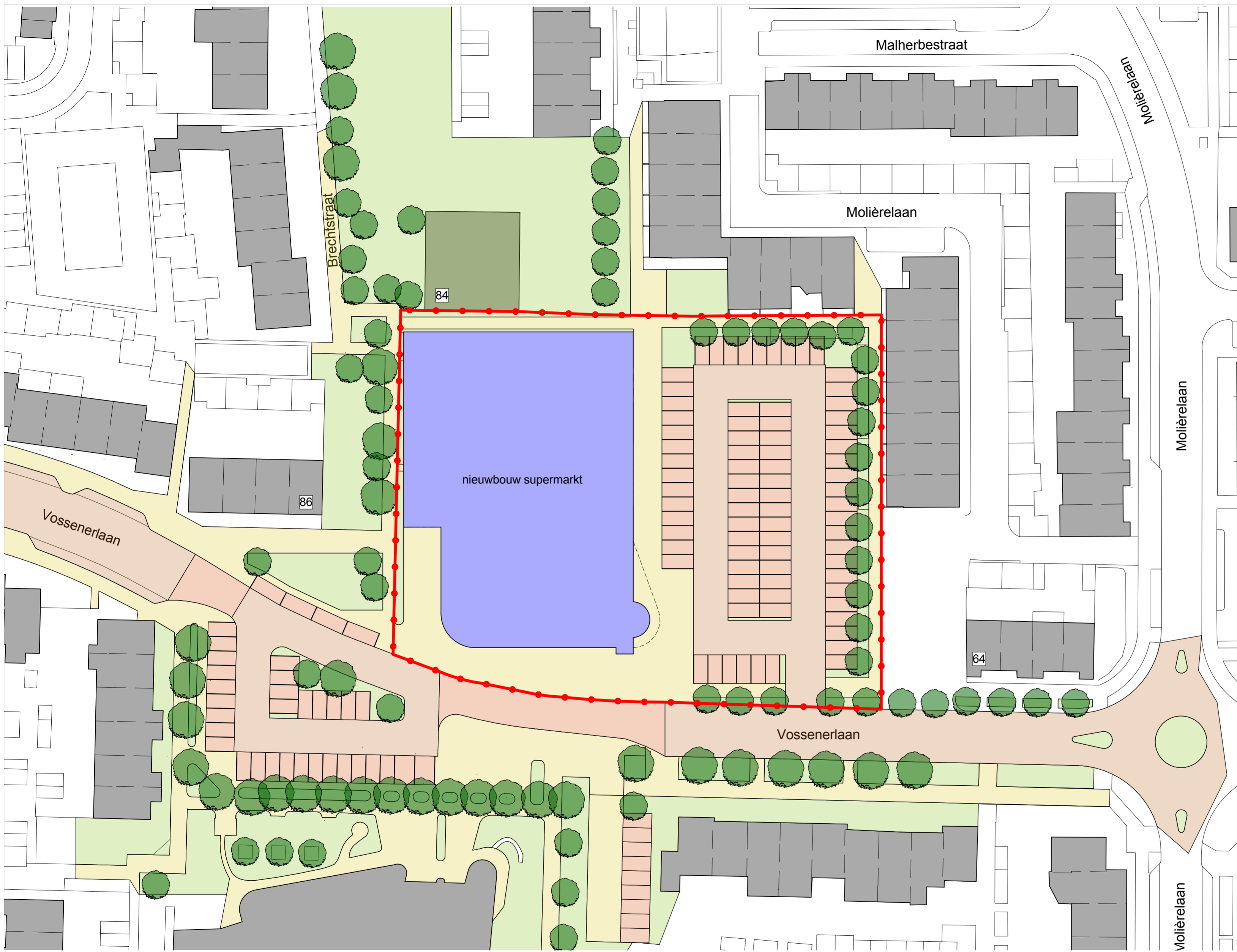
situatie plangrens 1:500

kadastrale gemeente Venlo Sectie: N nummers 1612, 1613, 4181 gedeeltelijk en 4401 gedeeltelijk