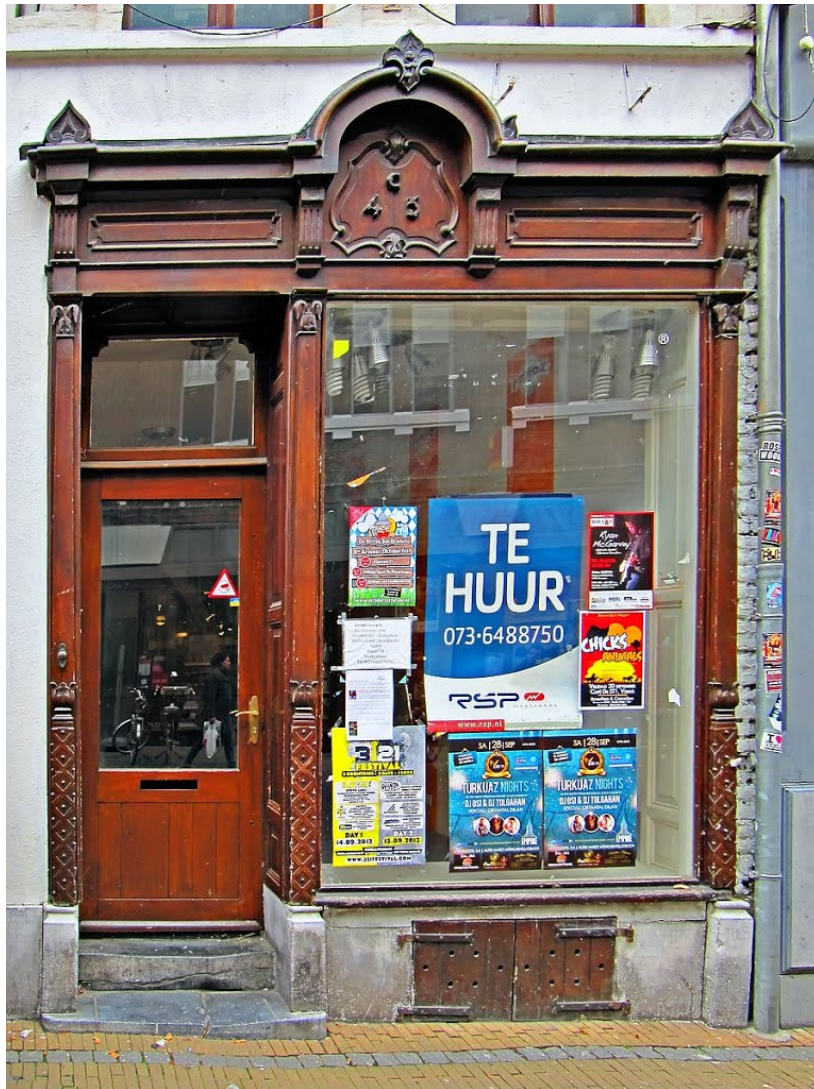
Trend: Toenemende winkelleegstand.