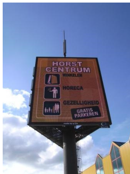
Foto: Samenwerking Inter Chalet en centrum van Horst (Complementariteit)