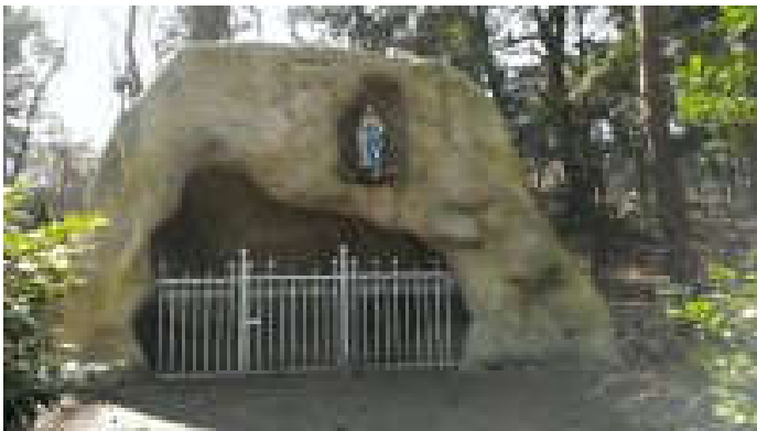
De “Lourdesgrot” op het terrein van klooster “Albertushof”.

In 2010 is de grot weer in gebruik genomen.