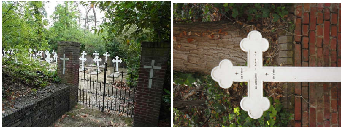
Het kloosterkerkhof van de paters, broeders en zusters Dominicanessen bij Klooster "Albertushof".

Het oudste graf dateert van 1861. De laatste overledene dateert van 2017.