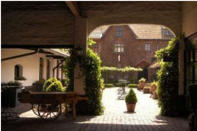
Doorkijk in de boerderij “Hendrikkenhof”. Middenachter het voormalige klooster “Albertushof”.

Tussen beide vleugels is het voormalige klooster “Albertushof” gebouwd.