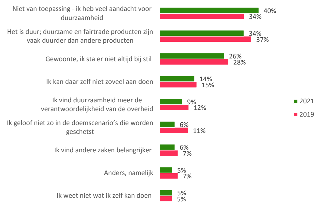
Figuur 3. Wat zijn voor u redenen om weinig, niet of niet meer aan duurzaamheid te doen?