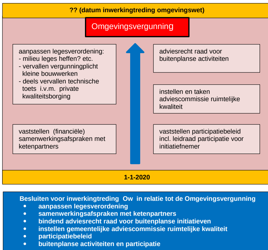
Figuur 2. Besluitvorming in relatie tot Omgevingsvergunning