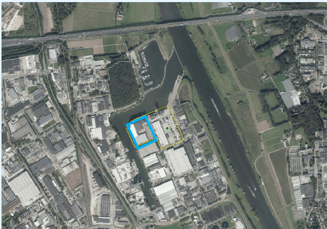
figuur 1: luchtfoto omgeving VTP (Bron: Google maps), met uitbreidingslocatie in blauw kader

De binnenvaartterminal ligt op het industrieterrein Venlo Trade Port in Venlo aan een aftakking van de rivier De Maas. Aan de noord- en oostzijde bevinden zich op minimaal 150 meter woningen en recreatiefuncties. In figuur 1 staat de inrichtingsgrens na realisatie van de uitbreiding op een luchtfoto met een gele lijn weergegeven, de beoogde uitbreiding is met een blauwe lijn weergegeven.