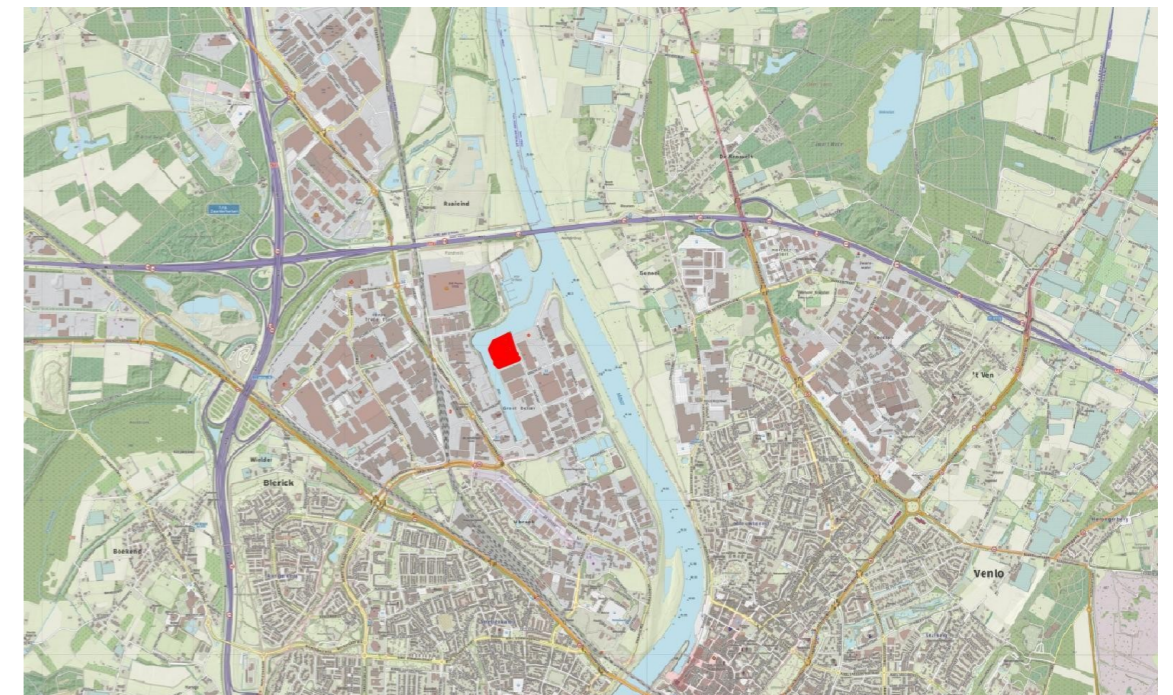
Ligging van het perceel

Om een goed oordeel te geven over de potentieel aanwezige beschermde planten en dieren, is op 21 december 2020 door een ecooloog van bureau Els & Linde, een bezoek gebracht aan de planlocatie. Ter plekke is beoordeeld of er beschermde soorten aanwezig kunnen zijn, die schade kunnen ondervinden van de geplande ontwikkelingen. Daarbij is gezocht naar sporen van dieren en is op basis van de begroeiing en de opbouw van het landschap, geschat of er beschermde soorten aanwezig kunnen zijn. De effecten worden beoordeeld als gevolg van de veranderde omgeving en het veranderde gebruik. Verder wordt geanalyseerd of de werkzaamheden die noodzakelijk zijn om de veranderingen te bereiken, een effect veroorzaken.