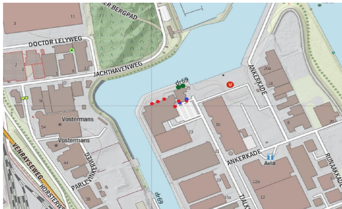
Groene stippen: mogelijke verblijfplaatsen boombewonende vleermuizen Rode stippen: Mogelijke verblijfplaatsen gebouwbewonende vleermuizen. Blauwe stippen: Mogelijke verblijfplaatsen gierzwaluwen.

Binnen de gebieden is kans op algemeen voorkomende soorten waarmee rekening moet worden gehouden. Aangetroffen dieren die niet uit zich zelf de werkgebieden kunnen verlaten, dienen – onder begeleiding van een ecoloog - in veiligheid te worden gebracht en buiten de werkgebieden te worden uitgezet. Schuilplekken zoals bladhoppen, hout- en steenstapels e.d. dienen eerst te worden gecontroleerd op schuilende dieren. In zijn algemeenheid dienen geschikte schuil- en overwinteringsplekken voor dieren buiten de werkterreinen intact te worden gelaten.