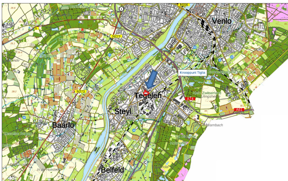
Figuur 1. Topografische kaart ligging van het plangebied (1:25.000)

Het plangebied is gelegen in de kern van Tegelen, ten noordwesten van het station. In figuur 1 is de topografische ligging van het plangebied weergegeven.