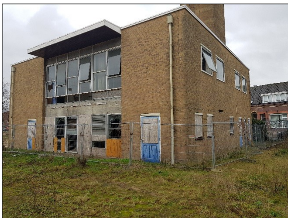
Figuur 8. Bestaande gebouw zuidwesten plangebied