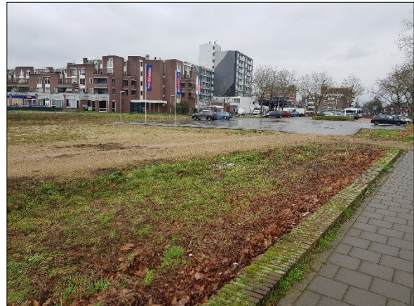
Figuur 5. Overzicht plangebied met parkeerplaats gezien vanaf Raadhuislaan