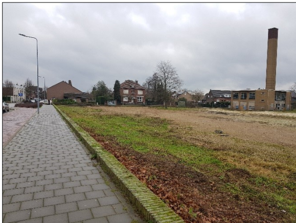
Figuur 6. Rand plangebied met Raadhuislaan