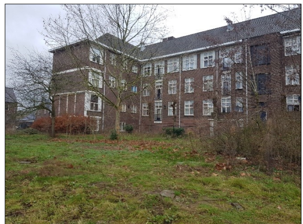
Figuur 9. Bestaande gebouw noordwesten plangebied