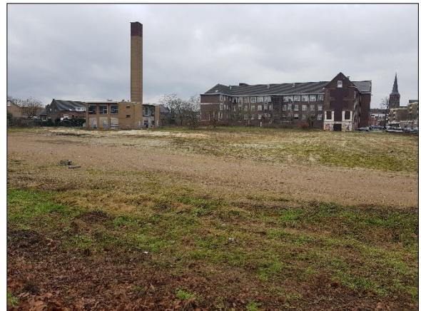
Figuur 7. Overzicht braakliggend gedeelte met bestaande bebouwing gezien vanaf Raadhuislaan