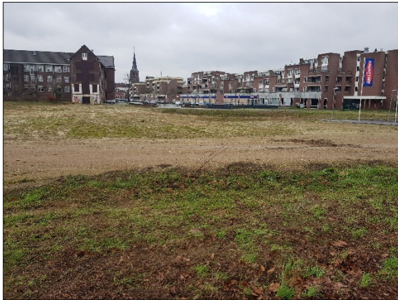
Figuur 4. Overzicht plangebied gezien vanaf Raadhuislaan