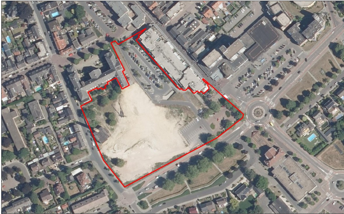
Figuur 2. Luchtfoto van het plangebied en de directe omgeving