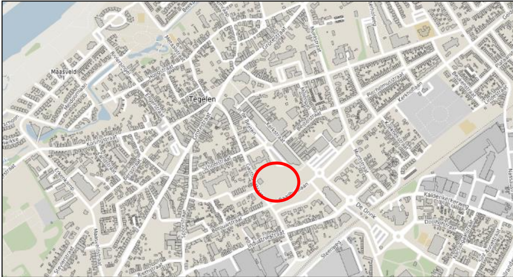
Figuur 1: planlocatie in rood aangegeven

Onderstaande figuur 1 geeft de locatie van het plangebied.