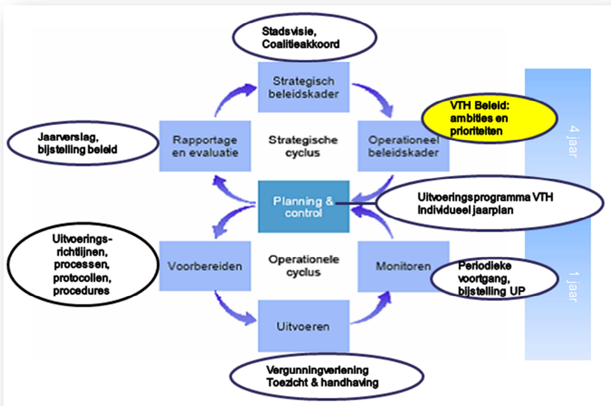
Figuur 1 BIG 8: strategische en operationele cyclus binnen VTH-werkveld.

Bovenin de strategische cyclus staan strategische beleidsdocumenten benoemd, die de input vormen voor het operationele beleidskader: het VTH beleid, geel gekleurd in de figuur. Het operationeel beleidsdocument VTH-taken vormt een meerjarig kader voor het UitvoeringsProgramma VTH (hierna: UP). In het UP staat beschreven wat het programma is voor het komende jaar, inclusief activiteiten en formatieve inzet. In het UP staan accenten benoemd, bijvoorbeeld extra noodzakelijke aandacht bij controles van een bepaalde branche of van een bepaald deelaspect (denk aan asbest, energie).