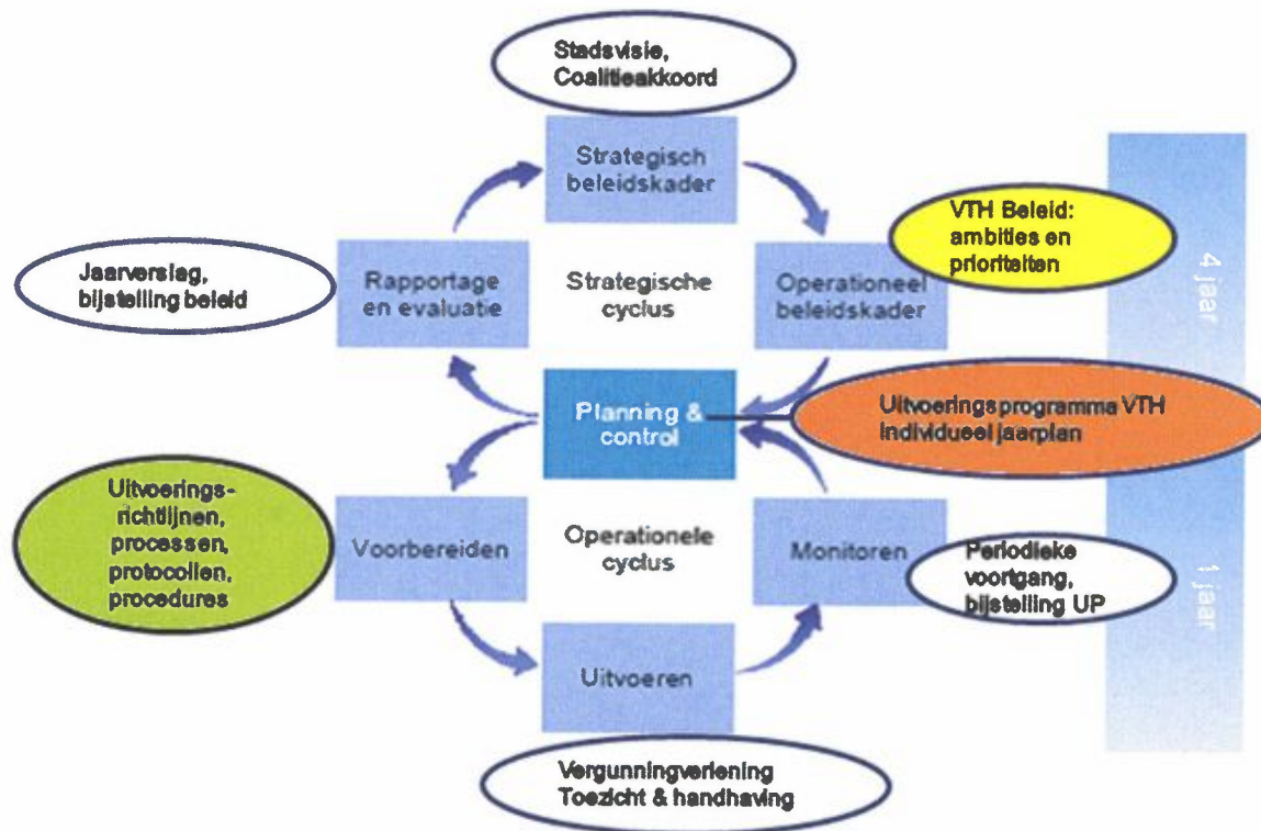
Figuur 1 BIG 8: strategische en operationele cyclus binnen VTH-werkveld.

een operationele cyclus. In beide cycli is sprake van een logische opeenvolging van werkzaamheden die worden beschreven in een aantal documenten.