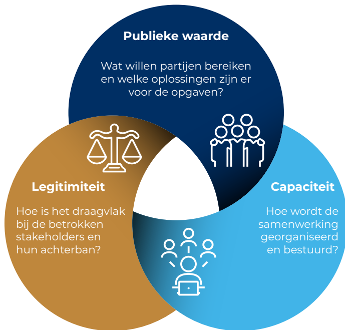
Figuur 1. Mark Moore Publieke waardemodel (onderzoeksmodel).

De politiek en bestuurlijke context van de gebiedsontwikkeling maakt dat het Publieke waardemodel (figuur 1) een toepasselijk model is voor dit onderzoek. Vanuit een goede balans tussen deze drie domeinen, ontstaat publieke waarde op een effectieve, efficiënte en gelegitimeerde wijze.