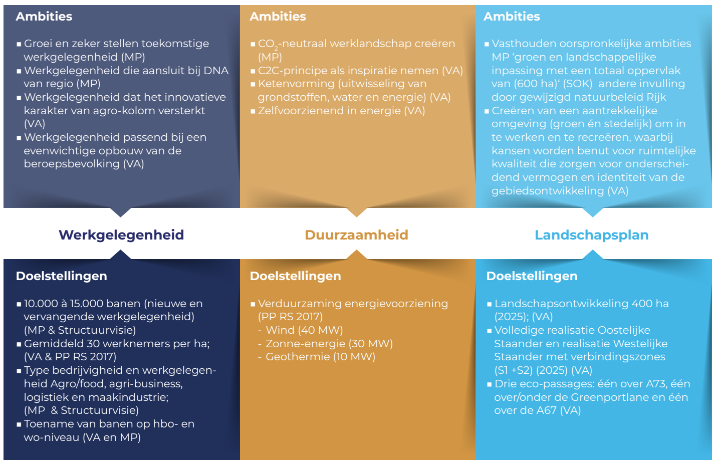
Figuur 3. Ambities en doelstellingen van de samenwerking. Voor betekenis afkortingen, zie voetnoot 8 .

Om de ambities en doelstellingen uit figuur 3 te verwezenlijken, heeft het Ontwikkelbedrijf op grond van de structuurvisie en de SOK de te ontwikkelen terreinen geïnventariseerd. De doelstelling voor de totale ontwikkeling van het gebied ziet er als volgt uit: