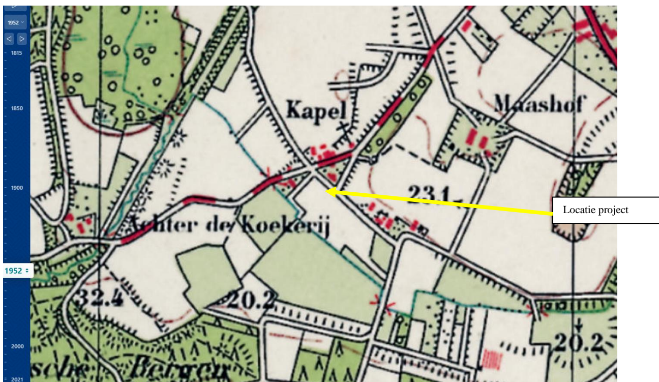
Figuur 2: Locatie van project op kaart 1952

De voorgaande kaart laat helder de oorsprong van het landschap lezen. Het laat zien hoe de locatie terug in de tijd is geweest. Destijds was de locatie grenzend aan een gehuchtje nabij kern Boekend. Omgeven met akker en het lagere weitje is het een typische plek. De bestaande buurboerderijen kenmerkten zich door de omkadering met hagen en fruitbomen op het erf en verder de open percelen tussen de bebouwingsclusters.