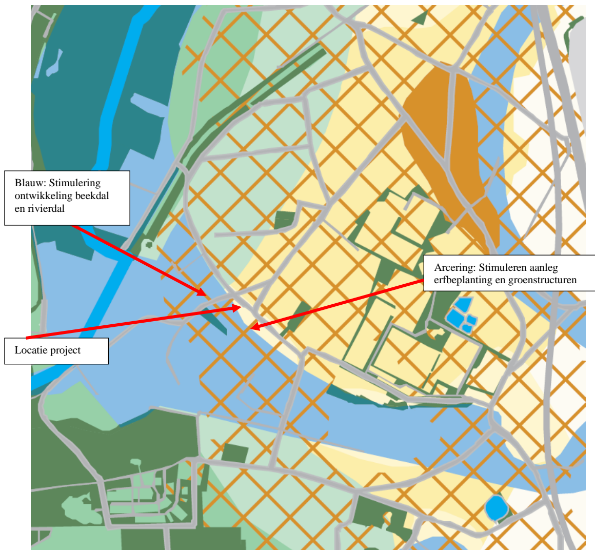
Figuur 3: Handreiking vanuit Landschapskader provincie Limburg

Vanuit het Landschapskader staat aangegeven dat de locatie gelegen is in een zone waar sterk wordt ingezet op stimulering erfbeplanting en groenstructuren. Aan de achterzijde grenst het aan het beekdal, dus hier is aankleding gericht op dit landschapstype, maar is net buiten de locatie.