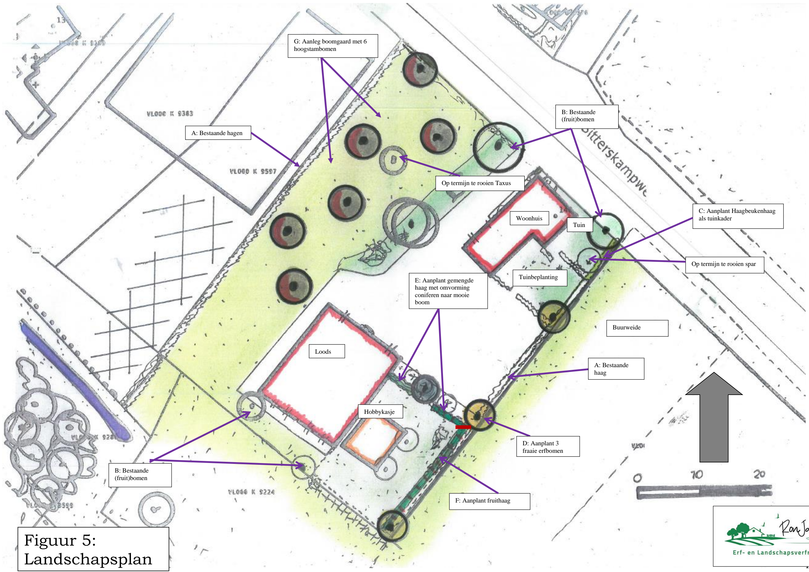
Figuur 5: Landschapsplan