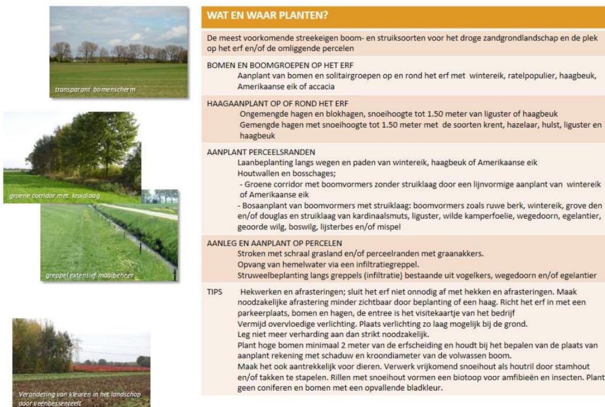
Figuur 4: Handvaten vanuit het inspiratieboekje zandgronden

Deze handvaten geven aan dat op een perfect erf/landschap gewerkt wordt met zowel eensoortige als gemengde hagen, met bomenrijen, boomgaarden en solitaire bomen. Dit betreft het groen in de zone grenzend aan het landschap en niet de tuin. Stimulering van overhoeken, bloemenranden, kruidenrijk grasland zorgt ook voor de biodiversiteitsimpuls. Voorgaande te verkrijgen middels een juist beheer!