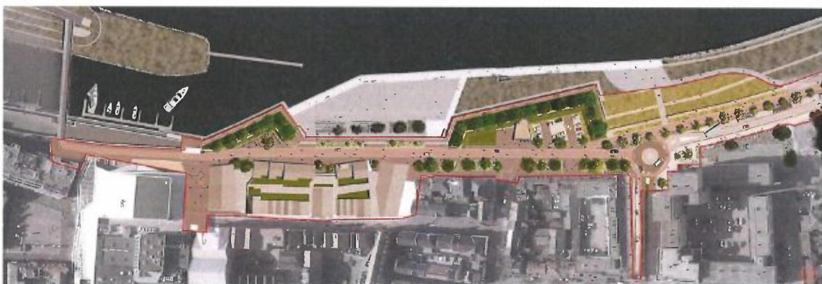
Ontwerpstudie Maaskade met kering 2022/2023

Tevens startte de gemeente, in het voorjaar van 2022, samen met een Klankbordgroep van bewoners, ondernemers, en met medeneming van het Waterschap Limburg, met het opstellen van een integraal ontwerp voor de openbare ruimte Maaskade en een nieuwe kering. Deze ontwerpstudie is inmiddels gereed. De volgende stap is een nader onderzoek naar de haalbaarheid van dit plan.