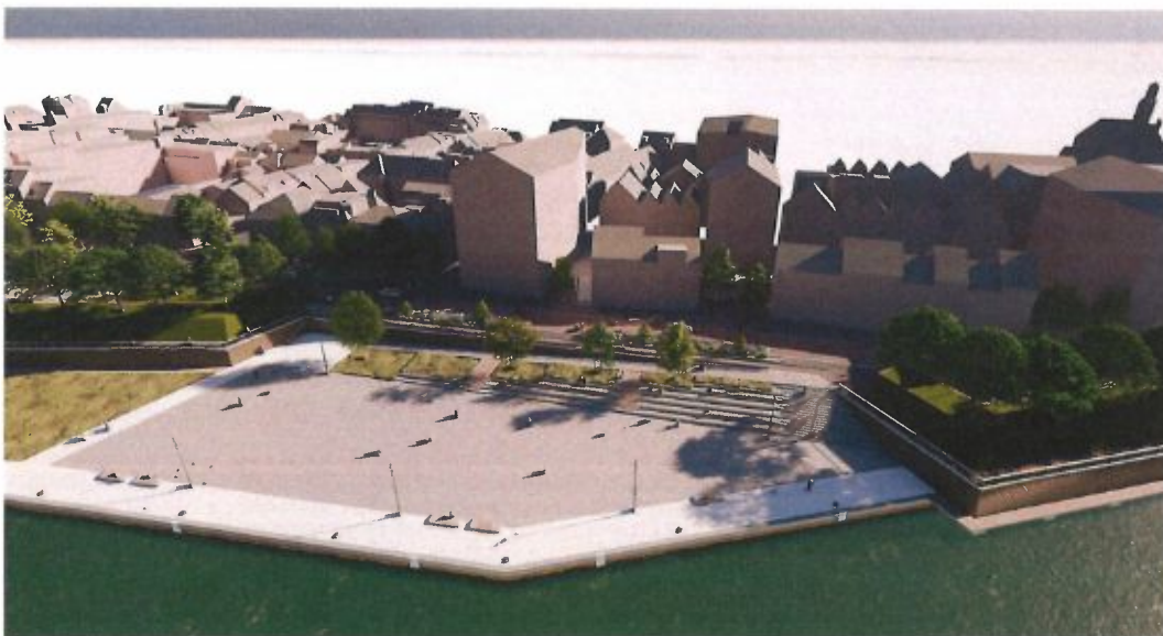
Ontwerpstudie Maaskade met kering 2022/2023

We hebben als college gekozen voor het hiervoor geschetste traject. Als we nu besloten hadden af te zien van het onderzoek dan blijft de haalbaarheid van een gezamenlijke aanpak ongewis. Het perspectief op een versnelde, gecombineerde doorontwikkeling en uitvoering van de kering en de openbare ruimte was dan ook op voorhand vervallen. Alles afwegend hebben wij ervoor gekozen om – gezien het nut van het onderzoek en het feit dat daar in relatie tot de bouwontwikkeling Aan de Stadsmuur ook nog voldoende tijd voor is – alle opties open te houden en te koersen op definitieve besluitvorming in november 2024.