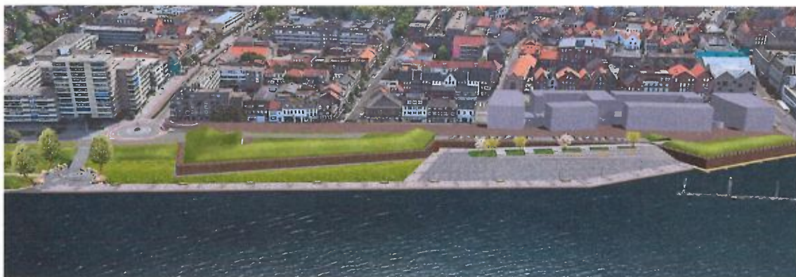
Visie uit 2017

In 2017 werd besloten tot de herinrichting van de Lage Loswal. Met de uitgevoerde herinrichting is fase 1 van de plannen gerealiseerd. Daarbij werd (als fase 2) ook een wenkend perspectief geschetst voor een nieuwe hoogwaterkering op de Maaskade, die tevens het vestingverleden van Venlo verbeeldt.