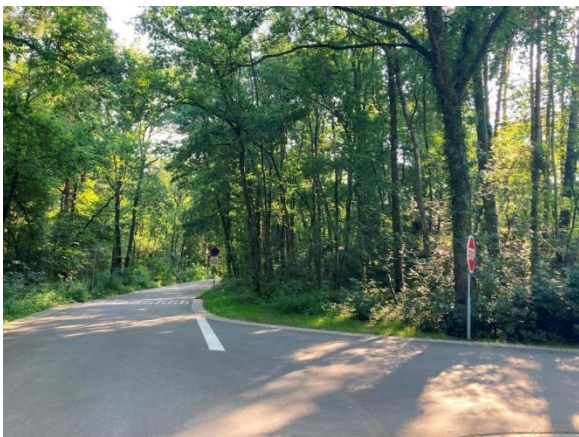
Uitgang Droomparken Maasduinen

Sommige automobilisten rijden hier wel 50-70 kilometer per uur, hetgeen hier veel en veel te snel is en in combinatie met fietsende en wandelende gezinnen een levensgevaarlijke cocktail is.