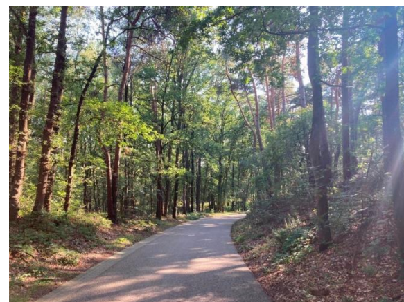
Tientallen meters hoger, ri. Kaldenkerken