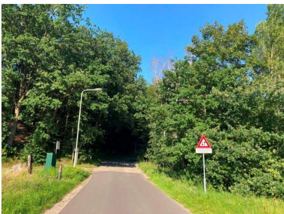
Aan de voet van "de Berg"