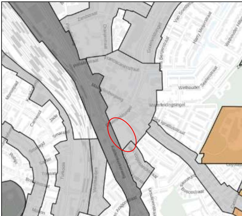
Figuur 4.1: Uitsnede welstandskaat gemeente Venlo met globale ligging plangebied (rood omcirkeld)