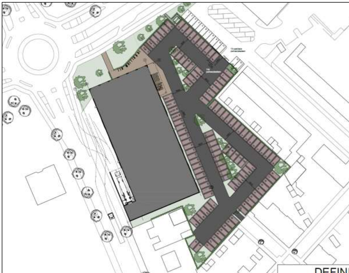
Figuur 3.2: Voorlopige inrichtingstekening toekomstige situatie

Ten behoeve van de bovenstaande functie zal ook een gedeelte van het plangebied worden ingericht als parkeerterrein met circa 118 parkeerplaatsen. Het terrein wordt ontsloten achter een hek dat buiten sluitingstijd van de discount supermarkt wordt afgesloten.