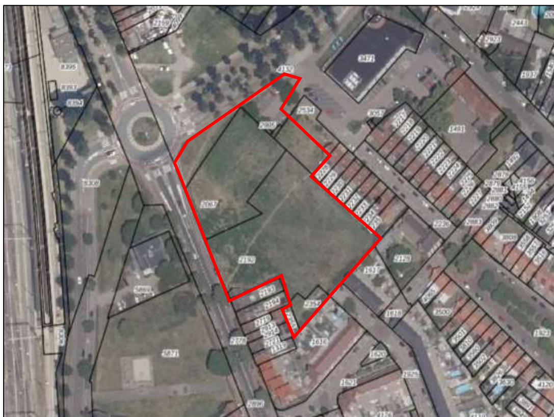
Figuur 2.1: Luchtfoto met ligging plangebied (rood omlijnd)

De toekomstige discount supermarkt zal worden gerealiseerd aan de Kaldenkerkerweg en de Groenveldsingel te Venlo, het zogenaamde voormalig Gebraterrein. Het plangebied bestaat momenteel uit een braakgelegen terrein, waarop bosschages gelegen. Het terrein heeft in 2012 de bestemming 'Groen' gekregen, omdat het terrein na de sloop van de oude opstallen een braakliggend ontwikkelingsterrein was, zonder dat er zicht was op een concrete nieuwe ontwikkeling. Op een klein gedeelte van de planlocatie liggen een aantal openbare parkeerplaatsen van de Albert Heijn die ten oosten is gelegen van het plangebied.