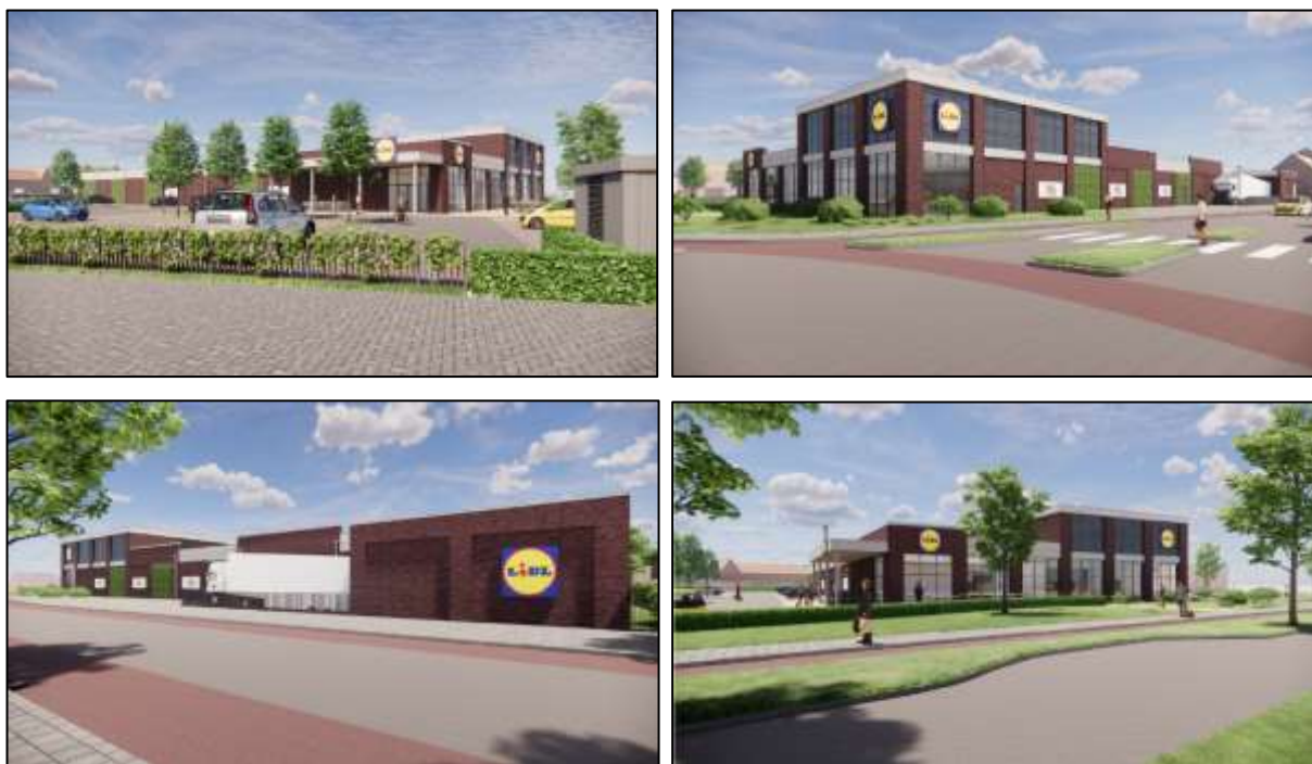
Figuur 3.4: Voorlopige sfeerimpressie toekomstige situatie

Voor het overige zijn er geen storende milieu-of verkeersaspecten die van invloed zijn op de bestaande woningen. Zowel stedenbouwkundig als ruimtelijk gezien is de bouw van de discount supermarkt dan ook niet bezwaarlijk. Onderstaand volgen een aantal sfeerimpressie foto's.