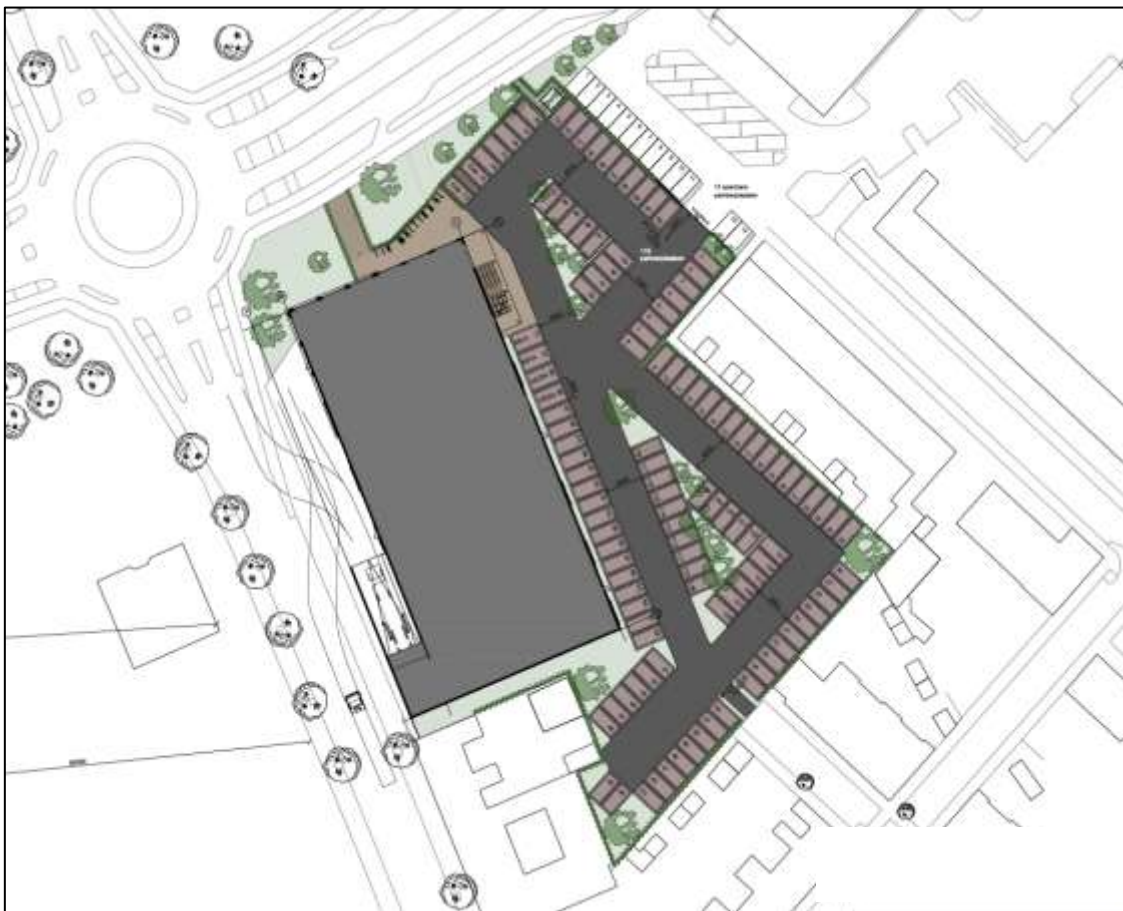
Figuur 1.1: Uitsnede inrichtingstekening toekomstige situatie

Tevens wordt de locatie van Lidl aan de Kraanvogelstraat in onderhavig bestemmingsplan meegenomen. Dit is om het gebruik als supermarkt ter plaatse juridisch-planologisch niet meer mogelijk te maken. In de verdere toelichting van onderhavig bestemmingsplan wordt dit als algemeen gegeven beschouwd als consequentie van de verplaatsing van de Lidl en wordt verder dan ook niet meer nader benoemd.