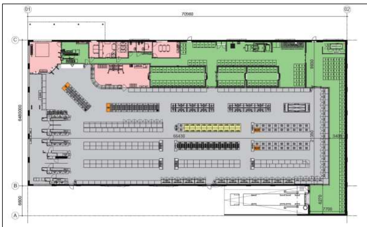
Figuur 3.1: Voorlopige plattegrond toekomstige discount supermarkt

De huidige Lidl-vestiging aan de Kraanvogelstraat 36 heeft een winkelvloeroppervlak (hierna: wvo) van circa 934 m 2 en een bruto vloeroppervlak (hierna: bvo) van circa 1.400 m 2 . De beoogde Lidl-vestiging aan de Kaldenkerkerweg heeft een oppervlakte van circa 2.355 m 2 bvo. Om enige flexibiliteit te behouden wordt in onderhavig bestemmingsplan een supermarkt van maximaal 2.415 m 2 bvo toegestaan. De beoogde supermarkt heeft een wvo van circa 1481 m 2 . Er is dus sprake van een toevoeging van 547 m 2 wvo aan supermarkt in de gemeente Venlo.