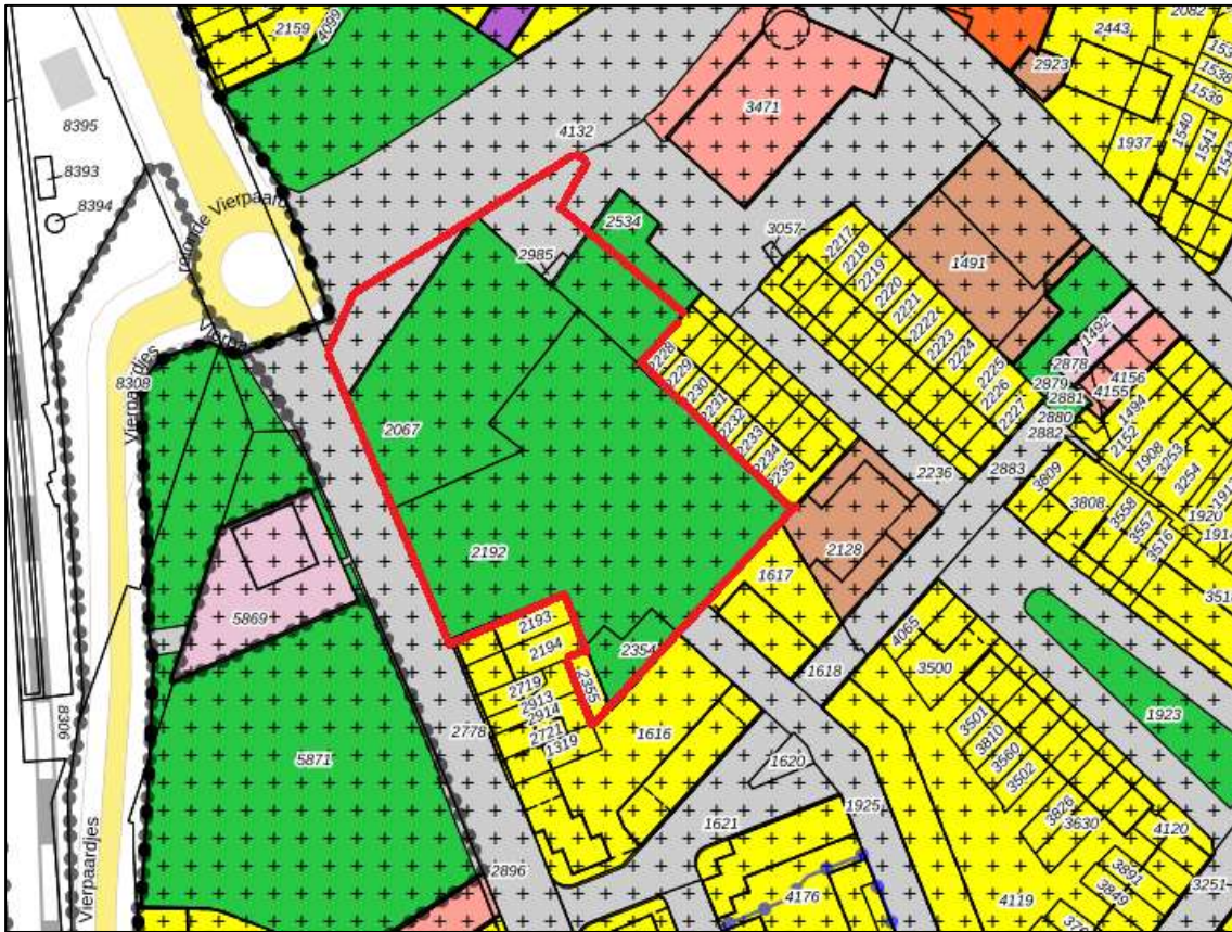
Figuur 1.3: Uitsnede verbeelding bestemmingsplan 'Venlo-Oost' (rode omlijnd)

In het voorliggende bestemmingsplan worden de nieuwe bestemmingen voor de gronden wettelijk geregeld, waardoor nieuwe bouw- en gebruiksmogelijkheden ontstaan om de ontwikkeling juridisch-plaanologisch te regelen. Het bestemmingsplan bestaat uit een verbeelding, de bijbehorende regels en deze toelichting.