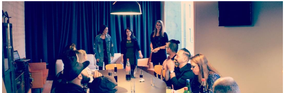
Figuur 1: Brainstormsessie met jongeren in het kader van het JSP

Voor de doelgroep 12+ is het JongerenServicePunt (JSP) in (door)ontwikkeling, in samenwerking met scholen en gezinscoaches én jongeren. Jongeren kunnen hier met allerlei vragen terecht en worden zo geholpen aan de juiste informatie, hulp of ondersteuning. Inmiddels is het JSP gestart op het Blariacum en het Valuascollege.