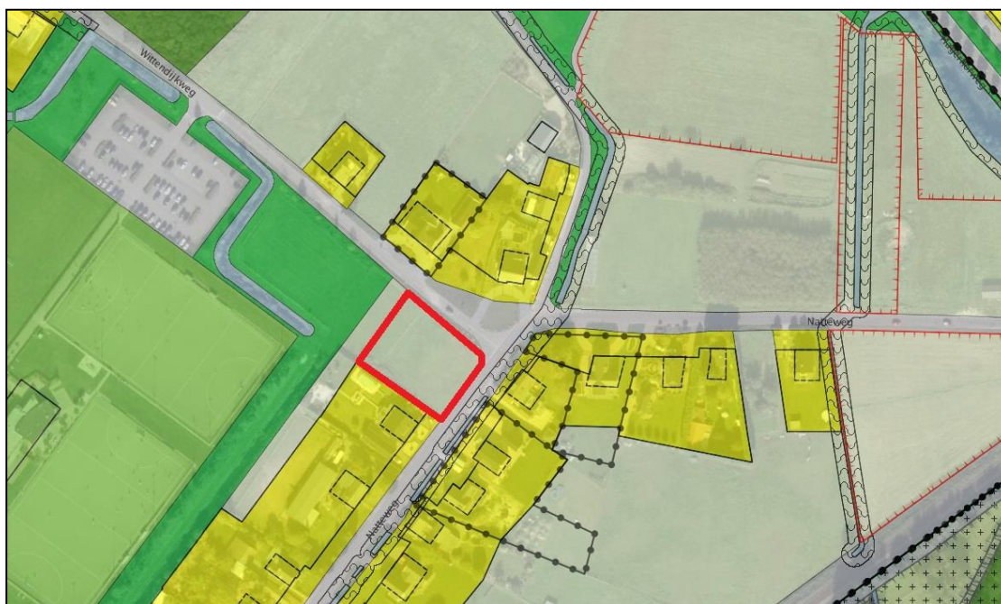
Uitsnede uit geldend bestemmingsplan Middengebied (plangebied rood omlijnd)

Voor het plangebied geldt het bestemmingsplan 'Middengebied', vastgesteld door de gemeenteraad van Venlo op 21 december 2011. Het plangebied heeft de bestemming 'Agrarisch'. De voorgenomen realisatie van een woning en het gebruik van het plangebied als woonperceel is binnen deze bestemming niet toegestaan.