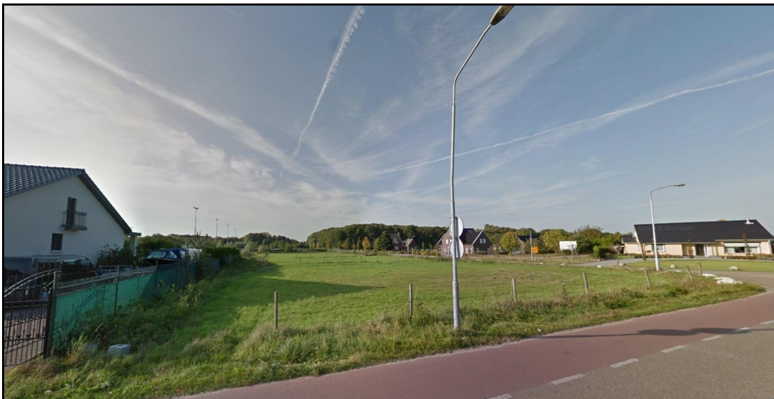
Huidige situatie plangebied gezien vanuit het zuidoosten (Natteweg)

Het plangebied maakt op dit moment onderdeel uit van een weiland. Direct ten noorden, oosten en zuiden van het plangebied bevinden zich woonfuncties. Ten westen van het plangebied zijn agrarische- en groenfuncties aanwezig, die het achterliggende sportpark landschappelijk beschermen.