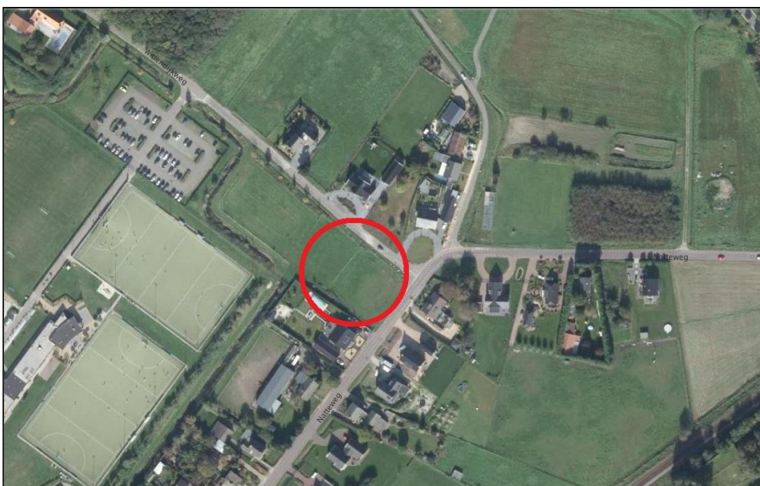
Luchtfoto plangebied (rood omlijnd)

De voorgenomen ontwikkeling past niet binnen het huidig geldend bestemmingsplan. Voorliggend bestemmingsplan is daarom opgesteld om de ontwikkeling juridisch-planologisch mogelijk te maken.