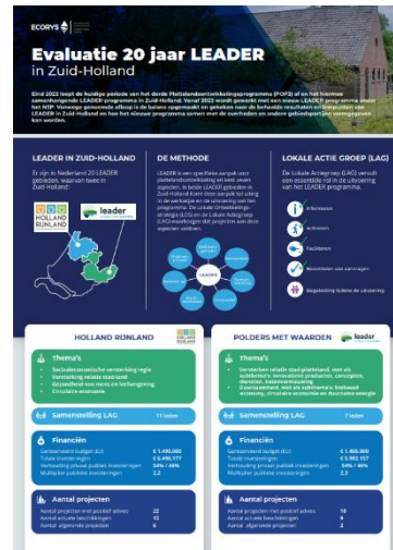
Figuur 3 Voorbeeld infographic