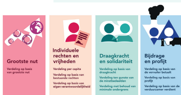
Figuur 2: Verdelingsprincipes (WRR, 2023)