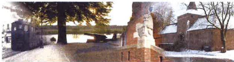
STICHTING DORP EN ERFGOED ARCEN | info@arcen.nu | www.arcen.nu

NEDERLANDSE TUINENSTICHTING NIEUWZEIJDS VOORBURGWAL 75 5015 1012 RE ZAMMTERDAAM INFO@TUINENSTICHTING.NL TELEFOON: 020 623 5058 INC 6545 95446