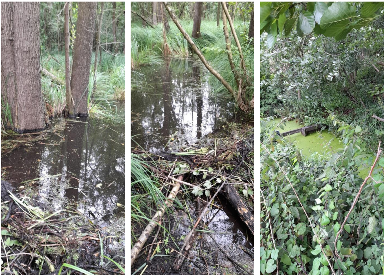
Een enorme vernatting van het gebied: langzaam maar zeker afstervende bossen

Zoals wij uit plaatselijke contacten vernamen is er een schouw geweest, in het voorjaar, om de situatie nader te bekijken. Daarbij waren o.a. de gemeente, de provincie Limburg, Staatsbosbeheer en het Waterschap Limburg en een buurtbewoner vertegenwoordigd.