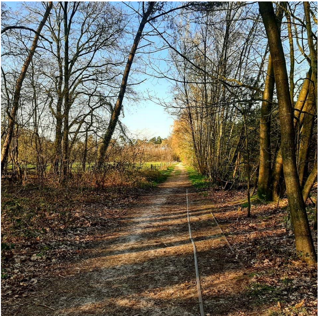
Enkele hectometers origineel smalspoor

Sporadisch komt men nog kleine stukjes tegen, echter aan de 3e Heideweg ligt nog een vrij lang stuk, dat je hier en daar nog net kunt zien. EENLokaal is van mening dat dit historische erfgoed moet blijven liggen en (deels) zichtbaar gemaakt. Het nog aanwezige smalspoor hindert niemand in de mobiliteit!