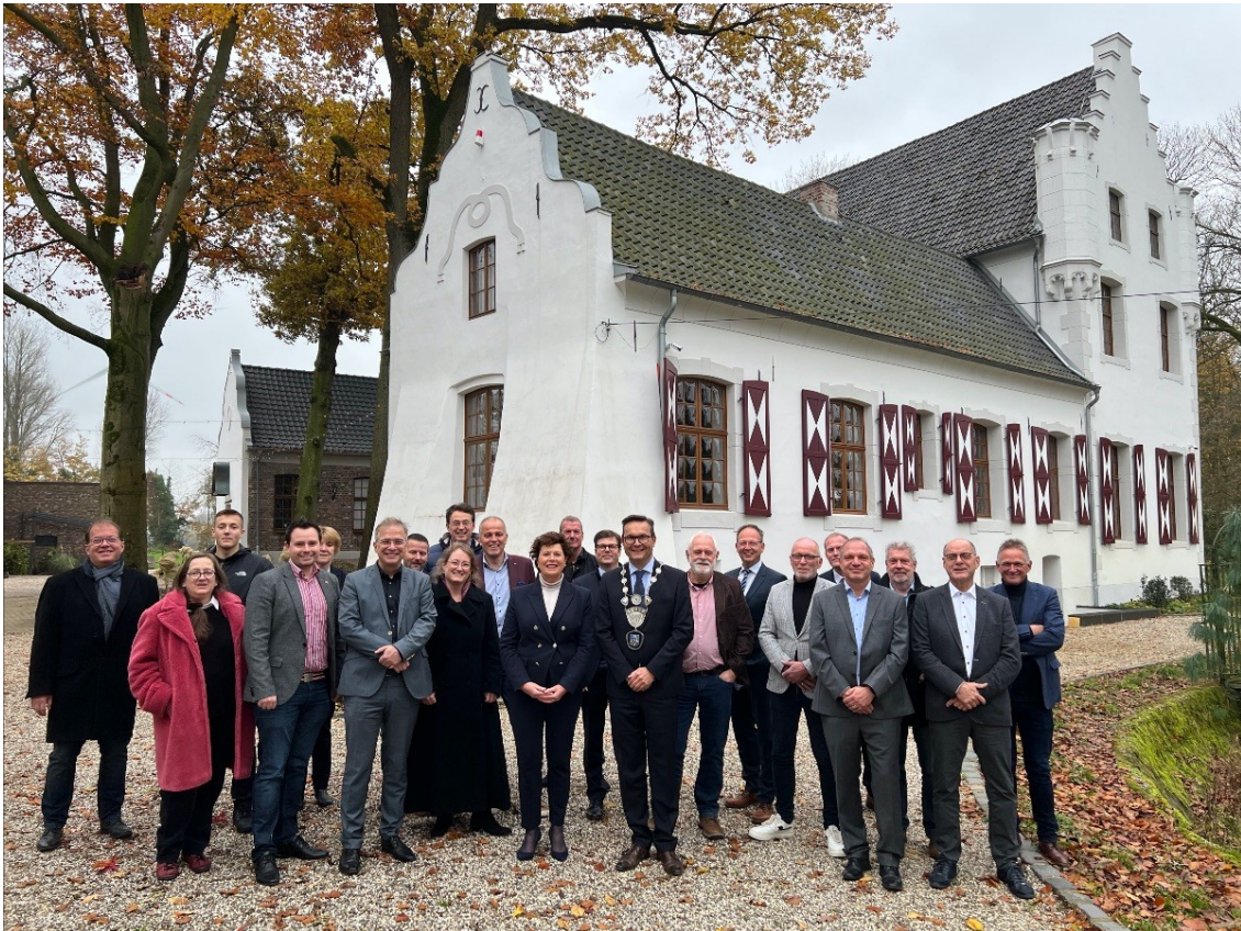
Foto boven: recente ontmoeting met Duitse en Nederlandse medewerkers in de jeugdzorg bij de Mutsaersstichting in Venlo.

Die Gemeinde Venray besuchte am 1. Dezember ihre Partnerstadt Geldern. Fraktionsmitglieder, Bürgermeister und Beigeordnete (wethouders) trafen sich im restaurierten Haus Ingenray. Beide Städte wollen einen Schüleraustausch organisieren, die Arbeit im Bereich der nachhaltigen Agrarwirtschaft fortsetzen und kommunale Mitarbeiter für drei Tage in der Partnergemeinde arbeiten lassen. Außerdem wurde überlegt, wie man Fachkräfte (wieder) an die Region binden kann und wie man die Stadtzentren, vor allem im Einkaufsbereich, gestalten kann.