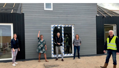
Buurtskap de Tuunen, Texel