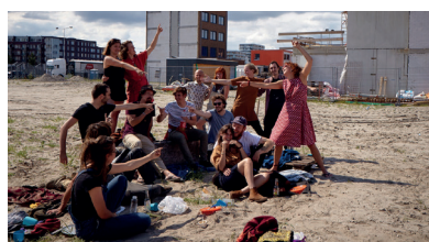
De Warren, Amsterdam (Stefan Hennis)