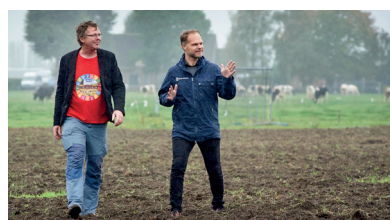
Ecodorp Boekel, Boekel