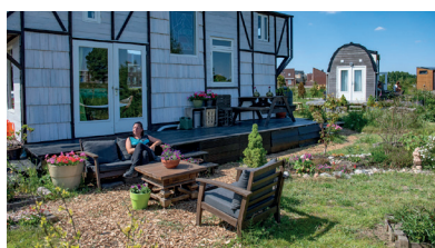
Duinvallei, Katwijk (Bluemonque)