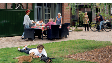
De Lindehoeve, Tilburg