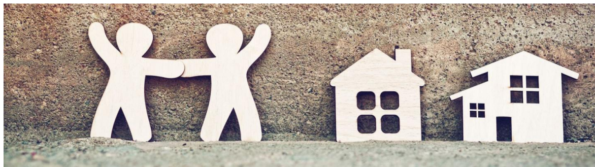
Noord- en Midden-Limburg