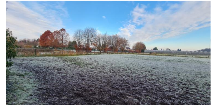
Figuur 5: Noorden van het plangebied, gezien vanuit het zuiden