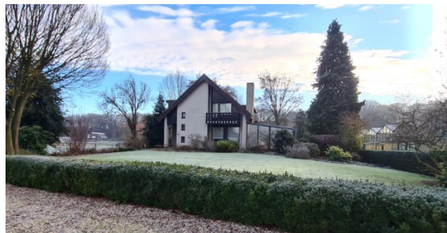
Figuur 8: bedrijfswoning gezien vanaf de Koelderstraat