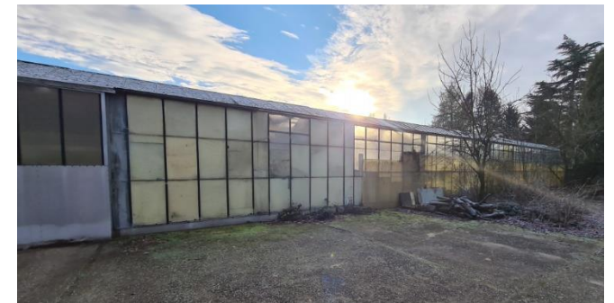
Figuur 6: Westgevel van de kas