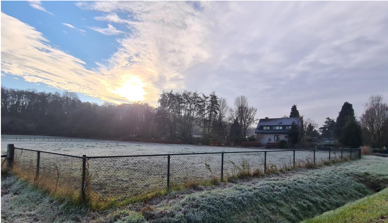
Figuur 4: Plangebied gezien vanuit het noorden, vanaf de Koelderstraat