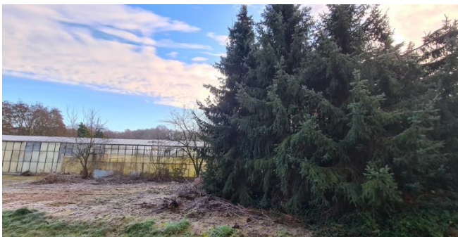
Figuur 7: Opgaand groen tegen de kas