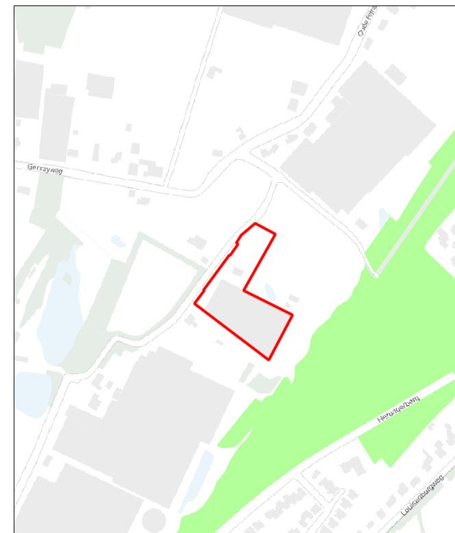
Figuur 10: Ligging goudgroene natuurzone (groen), zilvergroene natuurzone (geel), bronsgroene landschapszone (blauw) ten opzichte van perceel plangebied (rood omlijnd)

Het plangebied is niet gelegen binnen de goudgroene natuurzone, de zilvergroene natuurzone of de bronsgroene landschapszone (zie figuur 10). Het dichtstbijzijnde onderdeel betreft de goudgroene natuurzone, en ligt ongeveer 35 meter ten oosten van het plangebied. Gezien de aard van de voorgenomen plannen zullen de omgevingscondities redelijkerwijs gelijk blijven, waardoor de wezenlijke kenmerken en waarden van de goudgroene natuurzone niet worden aangetaast. Tevens zijn er binnen de goudgroene natuurzone ten oosten van het plangebied reeds verschillende woningen aanwezig. De soorten binnen de zone zullen reeds gewend zijn aan verstoring van licht en geluid, afkomstig van deze woningen. Gezien de woningen aan de Koelderstraat komen