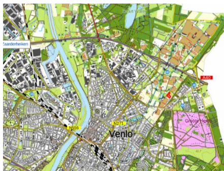
Figuur 1: Topografische kaart ligging plangebied (1:25.000)

De initiatiefnemer is voornemens een 4-tal woonkavels binnen het plangebied te realiseren. Het betreft 3 Ruimte voor Ruimte kavels, en 1 reguliere woonkavel. Om deze ontwikkeling mogelijk te maken zal de huidige kas worden geamoveerd. De bedrijfswoning zal enkel worden herstemd tot burgerwoning, en verder niet worden aangepast. Het opgaand groen binnen het plangebied wordt waar mogelijk behouden. Figuur 3 geeft een beeld van de toekomstige situatie.