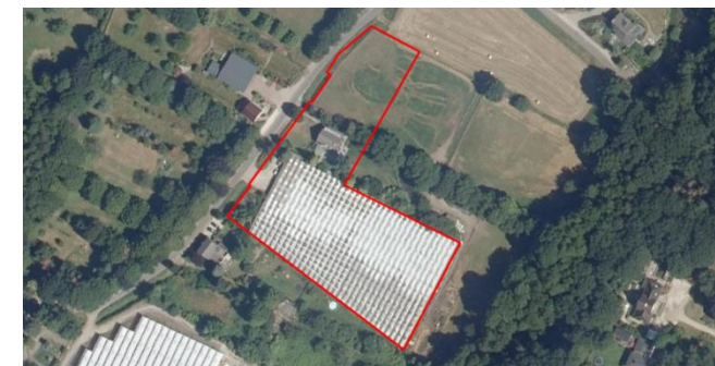
Figuur 2: Luchtfoto plangebied en directe omgeving