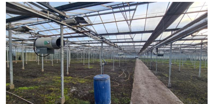
Figuur 9: Binnenzijde kas